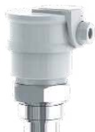
Protezione coprimorsetti BC 62 (in PP) e BC 62/L (in PVDF); grado di protezione IP 64