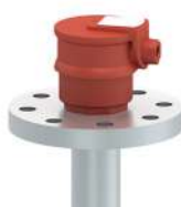
Protezione coprimorsetti B; materiale: acciaio zincato; grado di protezione IP 64